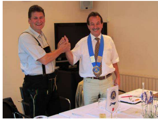
Der „alte“ und der „neue“ Präsident