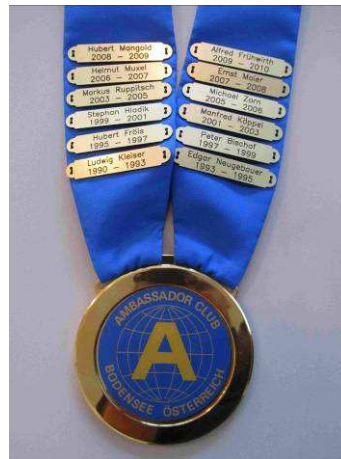
Präsidentenkette mit den Namensschildern der Präsidenten