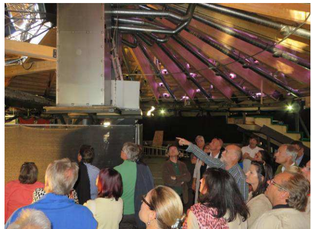
Spannende Einblicke in das Innere der Seebühne (Schildkrötenpanzer)